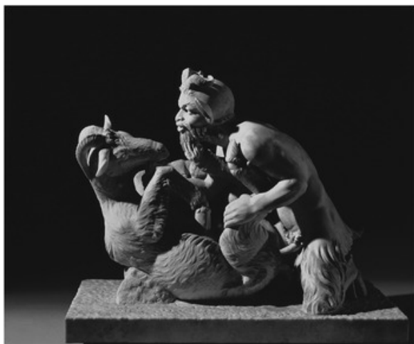
Ο Πάνας δεισοδύει σε μια θηλυκή κατσίκα. Γλυπτό που ανακαλύφθηκε το 1752.

Θα δούμε και πιο κάτω ότι ένα από τα βασικά στοιχεία που συγκροτούν την έννοια της πορνογραφίας είναι οι αξιολογικές κρίσεις. Η προβολή ιδεών όπως η σεμνότητα και η ηθική, φαίνεται ότι συνυφαίνουν το ποια αναπαράσταση ή και περιγραφή θεωρούμε πορνογραφία. Μια γρήγορη ματιά στην ακαδημαϊκή βιβλιογραφία για την εννοιολόγηση της πορνογραφίας, αποκαλύπτει ότι το τι ορίζεται ως πορνογραφία παραμένει ένα δύσκολο φιλοσοφικό ερώτημα πολλά χρόνια τώρα. Αν λάβουμε υπόψη μας και το γεγονός ότι για περισσότερο από 20 χρόνια οι σεξουαλικές αναπαραστάσεις και αφηγήσεις διαμεσολαβούνται από την ψηφιακή τεχνολογία, το πρόβλημα της εννοιολόγησης γίνεται ακόμα πιο πολύπλοκο.