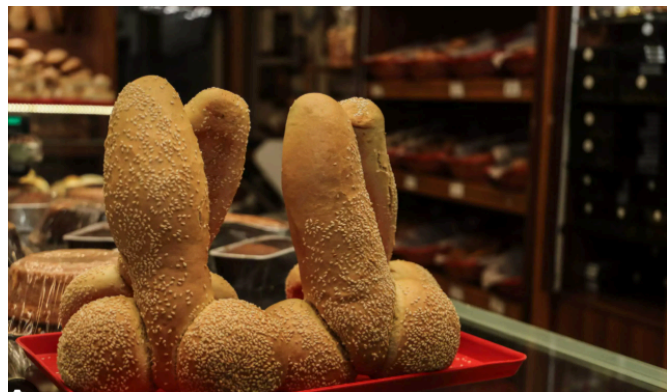
Προϊόντα που πωλούνται στο πλαίσιο της γιορτής του φαλλού

αλλάζει και η σεξουαλική γλώσσα θεωρείται σχεδόν απαραίτητη για να συμπληρώσει το χαρακτήρα της ατμόσφαιρας. Οι αναπαραστάσεις, η γλώσσα και τα αντικείμενα εξυμνούν τον ερχομό της άνοιξης και τη γονιμότητα μέσω ενός κεντρικού συμβόλου που είναι ο φαλλός (πέος σε στύση). Και πάλι, εδώ, η επίκληση στην ανάγκη διατήρησης της σχέσης του σήμερα με το χθες, αυτή της τιμής στις παραδόσεις και στα έθιμα ενός τόπου, δικαιολογεί τις "άσεμνες" συμπεριφορές, εικόνες και την "απρεπή" επικοινωνία μεταξύ των ανθρώπων κάθε φύλου.